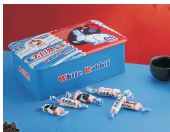
图1 大白兔60周年纪念盒

2.2.2 包装结构及材料 食品包装的结构和材料可以说是产品呈现的重要条件,好的食品包装往往在材料上就