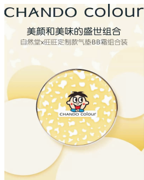
图 5 自然堂和旺旺合作的气垫

如图 5,自然堂和旺旺合作的气垫款 BB 霜,从造型上来说仍然使用传统圆形气垫设计,但其在图案上运用了旺旺的经典 IP 形象,同时运用了旺旺旗下“雪饼”这一产