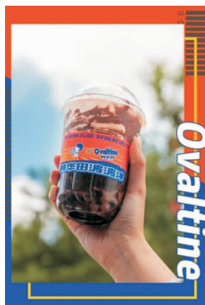
图10 喜茶和阿华田的联名款产品