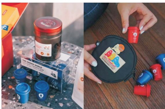
图7 三顿半 x 韩国品牌 FRITZ COFFEE 的联名款包装