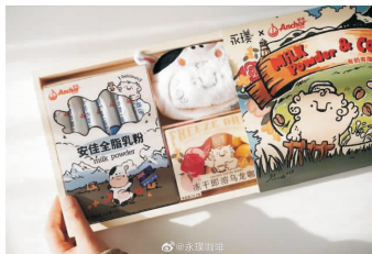
图2 永璞和安佳合作产品