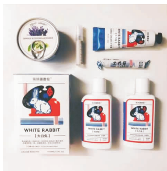
图9 大白兔与气味图书馆推出的香氛系列

随着跨界热在食品行业的关注度不断提高，食品品牌跨界的案例不在少数，越来越多的食品品牌打着强强联合的心态与不同类型的品牌合作，然而真正成功的品牌并非很多。跨界联名食品包装就互动性来说也逐渐暴露出了诸多问题，笔者主要从如下3个方面进行分析。