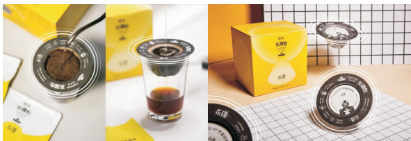
图 6 永璞的“灰碟包”产品的使用图

另有咖啡品牌三顿半常与同类型品牌合作,他们主要注重咖啡口味上产生的变化,就外包装来说一直采用“小垃圾”桶的形象,同时联名款的包装也偏简洁大方。图 7 为三顿半 x 和韩国品牌 FRITZ COFFEE 的联名款包装。其包装美观,即使商品在使用完之后,仍可以继续使用,包装的可延续性得到充分的发挥。