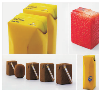
图3 深泽直人设计的果汁系列

食品包装很多通过“五感”设计来呈现,因为食品作为产品本身的属性就需要通过味觉来完成,再辅以其他感官的刺激,都会产生不错的吸引力。如图3是日本深泽直人设计的果汁系列,他在包装上运用视觉和触觉的集合,更直观地传达给消费者商品所对应的信息。