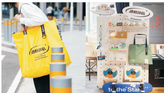
图8 部分“返航计划”的周边产品

“跨界”的产品容易勾起消费者的丰富的感受，对不同类别消费者的情感把握、痛点把握和需求把握，都需要设计者设身处地感受和分析，引起双方的情感共鸣 [9] 。通过这种手法使许多老字号的品牌重新回到了大众视野，以新的方式呈现品牌长久以来所具有的文化底蕴，重新唤起对该食品的情感记忆，如大白兔奶糖与气味图书